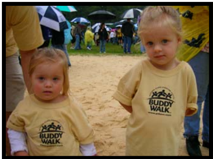
El "Buddy Walk" Evento anual— una manera divertida de celebrar a personas quienes tienen ¡Síndrome Down!

PDSSN le da la acogida a familias nuevas, provee oportunidades sociales y educacionales a miembros y educa a la comunidad promoviendo conocimiento, respeto, e inclusión de personas con Síndrome Down. ¡Les invitamos unirse a PDSSN! Nuestra membrecía está abierta a cualquiera interesado en apoyar a individuos con Síndrome Down. Visite nuestro sitio en la red, www.pdssn.com para recibir mas información y para descargar una aplicación o llame al numero en este panfleto y le